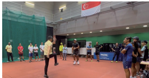
AIC Singapore Lecturers and workshop scene