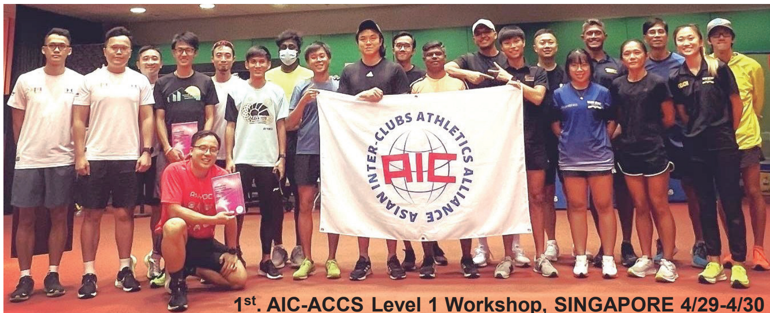
1st. AIC-ACCS Level 1 Workshop, SINGAPORE 4/29-4/30